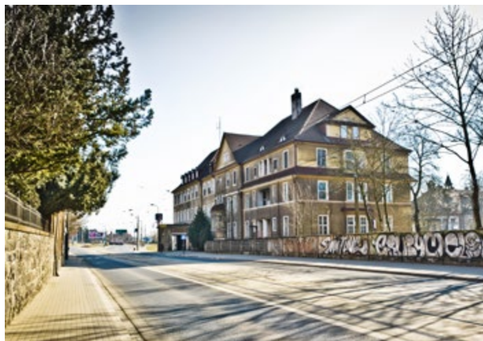
Budynki poszpitalne przy ul. Warszawskiej