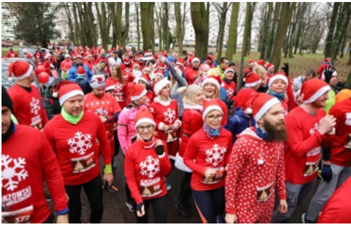
Gorzowski Bieg Gwiazdkowy