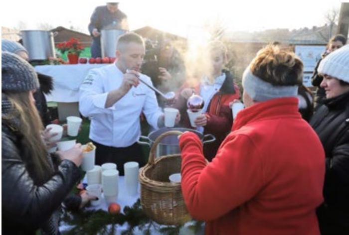
Gotowanie „Barszczu po gorzowsku”