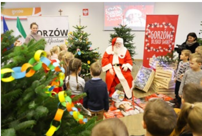
„Dzieci dzieciom” na Mikołajki