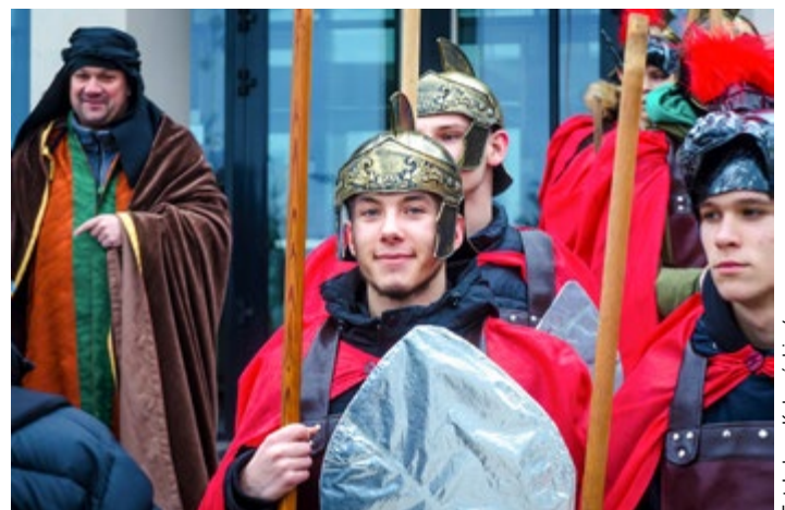
Orszak Trzech Króli 2019 r.