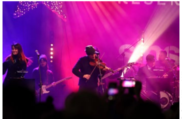
Koncert Zakopower Kolędowno