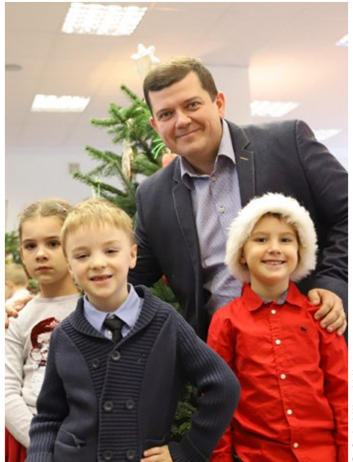
„Dzieci dzieciom” na Mikołajki