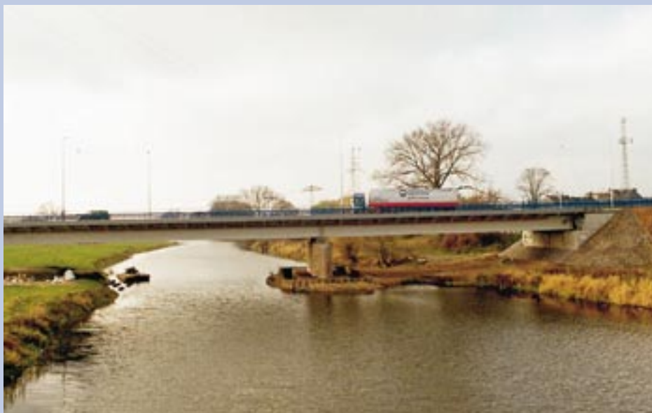
Nowy most na kanale Ulgi

Zgodnie z ustawą o drogach publicznych przebieg drogi krajowej ustala w drodze rozporządzenia minister właściwy do spraw transportu, po zasięgnięciu opinii miasta na prawach powiatu właściwego zarządu miasta, co nastąpi po uchyceniu przez Radę Miejską uchwały opiniującej poprzedni przebieg dróg krajowych. Rada uchyliła już poprzednią wersję drogi 22 i zaaprobowowała nowy jej przebieg. (df)