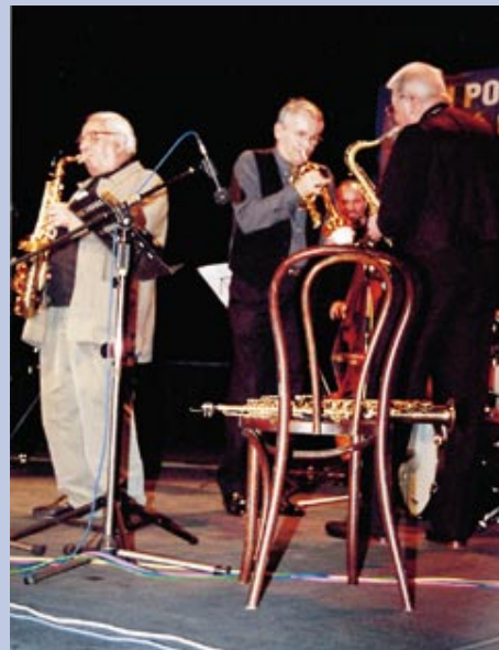
Gwiazdą XXVI Pomorskiej Jesieni Jazzowej (17 listopada) był legendarny Jerzy Duduś-Matuszkiewicz, saksofonista, kompozytor, autor muzyki m.in. do „Stawki większej niż życie” i „Czterdziestolatka”. W części konkursowej zwyciężył zespół „Epsylon”.