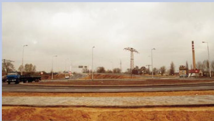
Rondo przy wjeździe na nowy most na kanale Ulgi – bez nazwy jeszcze. Planowana jest na nim fontanna.