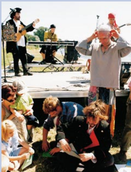
Dni Gorzowa 2000 – poza imprezami na Starym Rynku, wyjątkowo dużo działo się nad Wartą, do której przez wiele lat miasto odwracało się plecami. Brandenburski Statek Artystyczny, koncerty na estradzie obok, zabawy na trawie odświeżyły zażyłość mieszkańców z rzeką.

* XXVI Pomorska Jesień Jazzowa; * Gorzowskie Spotkania Teatralne z udziałem 10 teatrów z Polski i 1 z Niemiec. * 9 premier Teatru im. J. Osterwy. Poza imprezami o wysokim poziomie artystycznym, miasto oferowało mieszkańcom imprezy masowe w ramach „Dni Gorzowa”, a także Noc Sylwestrową na Starym Rynku. (dj)