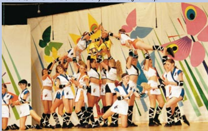
Wspaniałą zabawą dla dzieci na estradzie i na widowni był VII Ogólnopolski Festiwal Zespołów Tanecznych Dzieci i Młodzieży Szkolnej.