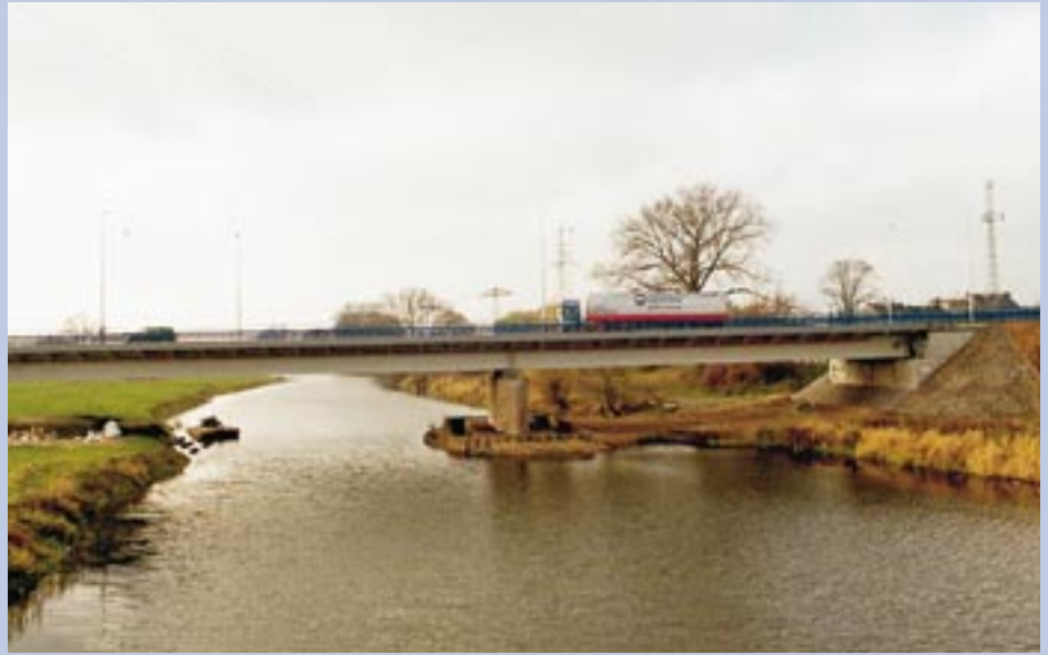
Nowy most na kanale Ulgi

Zgodnie z ustawą o drogach publicznych przebieg drogi krajowej ustala w drodze rozporządzenia minister właściwy do spraw transportu, po zasięgnięciu opinii miasta na prawach powiatu właściwego zarządu miasta, co nastąpi po uchynieniu przez Radę Miejską uchwały opiniującej poprzedni przebieg dróg krajowych. Rada uchylła już poprzednią wersję drogi 22 i zaaprobowowała nowy jej przebieg. (df)