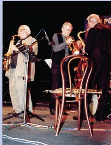
Gwiazdą XXVI Pomorskiej Jesieni Jazzowej (17 listopada) był legendarny Jerzy Duduś-Matuszkiewicz, saksofonista, kompozytor, autor muzyki m.in. do „Stawki większej niż życie” i „Czterdziestolatka”. W części konkursowej zwyciężył zespół „Epsylon”.