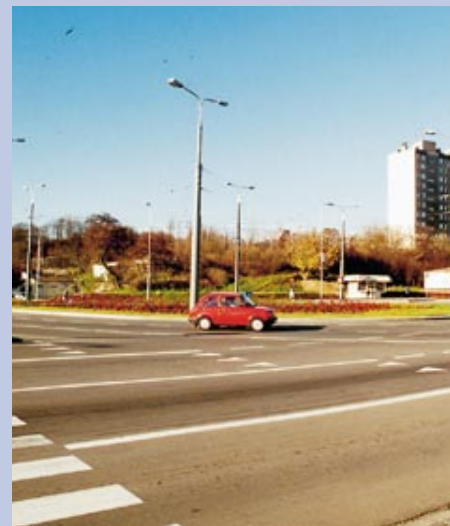
Rondo Szembeka. Do kompletnej prezentacji gorzowskich rond brakuje tylko zdjęcia z ronda na skrzyżowaniu Piłsudskiego i Alei Odrodzenia.