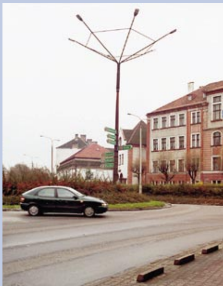
Najstarsze gorzowskie rondo – Rondo Wiosny Ludów.