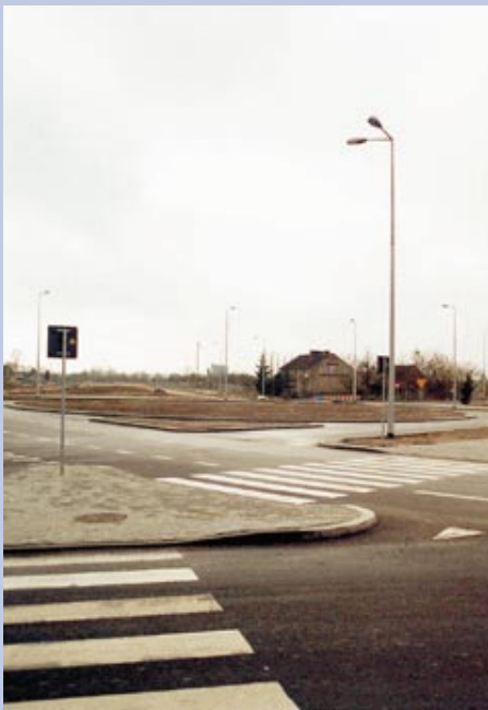
Rondo przy ul. Kasprzaka