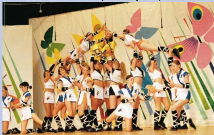
Wspaniałą zabawą dla dzieci na estradzie i na widowni był VII Ogólnopolski Festiwal Zespołów Tanecznych Dzieci i Młodzieży Szkolnej.