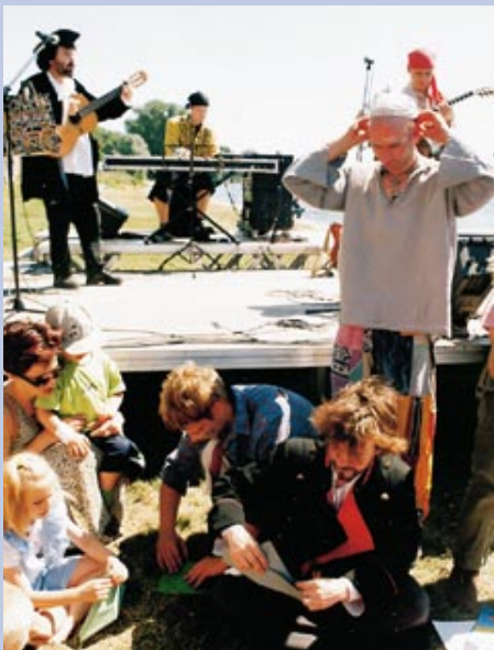
Dni Gorzowa 2000 – poza imprezami na Starym Rynku, wyjątkowo dużo działo się nad Wartą, do której przez wiele lat miasto odwracało się plecami. Brandenburski Statek Artystyczny, koncerty na estradzie obok, zabawy na trawie odświeżyły zażyłość mieszkańców z rzeką.

* XXVI Pomorska Jesień Jazzowa; * Gorzowskie Spotkania Teatralne z udziałem 10 teatrów z Polski i 1 z Niemiec. * 9 premier Teatru im. J. Osterwy. Poza imprezami o wysokim poziomie artystycznym, miasto oferowało mieszkańcom imprezy masowe w ramach „Dni Gorzowa”, a także Noc Sylwestrową na Starym Rynku. (dj)