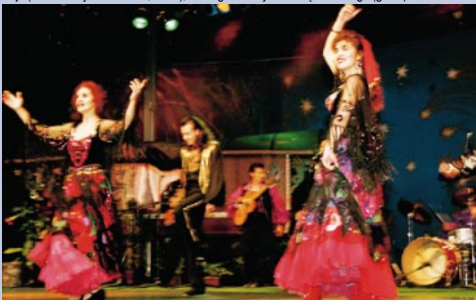
Jak zwykle nastrojowe i niezwykle kolorowe były Międzynarodowe Spotkania Zespołów Cygariskich „Romane Dyvesa”.