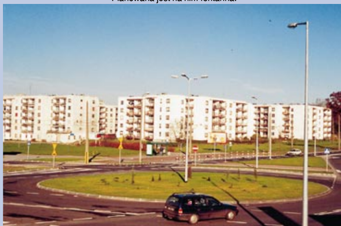
Rondo na skrzyżowaniu Walczaka i Górczyńskiej, nazywane już niekiedy Rondem Gdańskim, choć oficjalnej nazwy nie ma jeszcze.