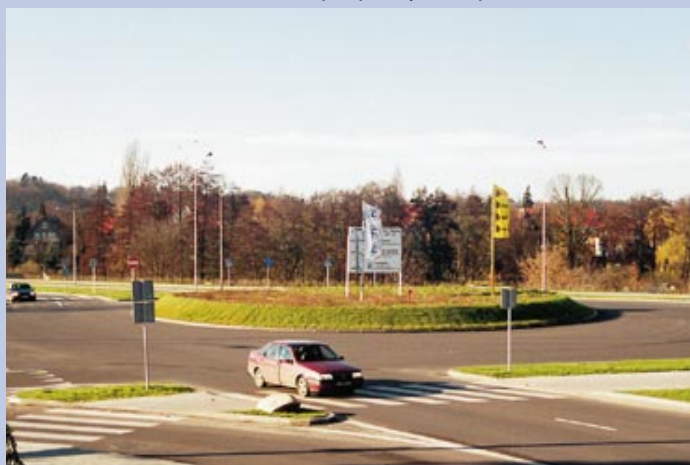
Rondo na skrzyżowaniu ul. Kardynała Wyszyńskiego i Alei Odrodzenia