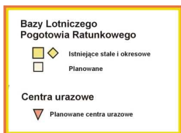
Mapa przedstawiająca rozmieszczenie baz HEMS w Polsce.

Pomimo rozmów prowadzonych w wielu gremiach: administracji rządowej, samorządowej czy instytucji zdrowia temat bazy dla Gorzowa został pominięty we