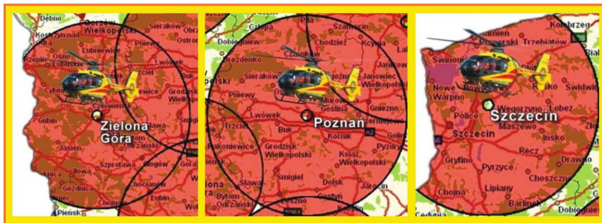
Mapy przedstawiające podstawowy zasięg działania HEMS.

Dzisiejsze rozlokowanie baz HEMS w naszym regionie stawia Gorzów i jego okolice w bardzo niekorzystnej sytuacji., gdyż podstawowy zasięg działania śmigłowca EC 135 wynosi 80 km** i jest osiągany w ciągu 22 minut. Rejon operacyjny działania śmigłowców – według oficjalnych danych ze strony LPR – startujących z Zielonej Góry, Poznania czy Szczecina sięga w najlepszym wypadku terenu gmin sąsiadujących od północy, południa i wschodu z Gorzowem Wielkopolskim. Nie oznacza to oczywiście braku lotów LPR w naszym regionie, jednak czas oczekiwania na transport lotniczy z wspomnianych baz HEMS jest znacznie wydłużony. Co w przypadkach krytycznych może zdecydować o czymś życiu lub śmierci.